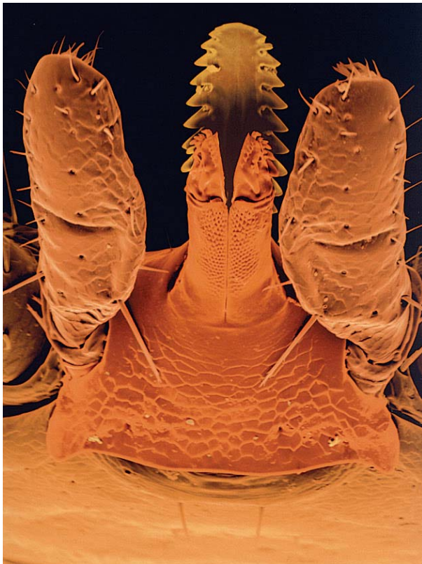
Figure 2 : Pièce buccale (rostre) de la tique