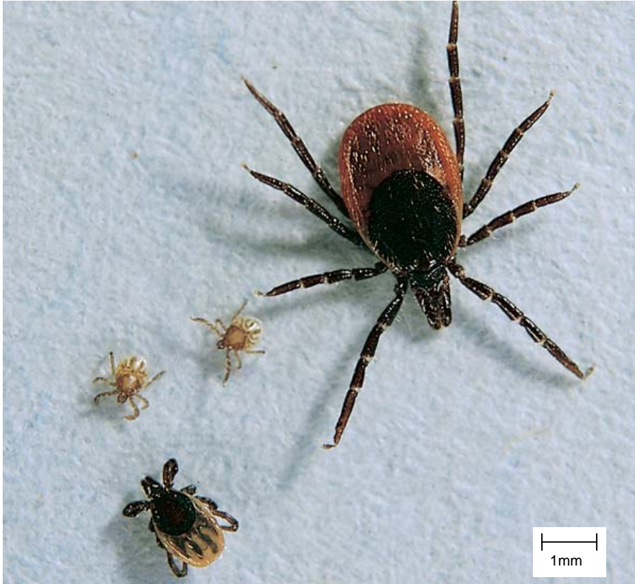
Figure 1 : Tique Ixodes ricinus : stades Larves adulte femelle Nymphe